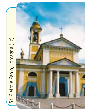
Ss. Pietro e Paolo, Lomagna (Lc)